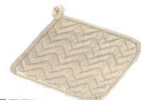
⑫ テフロン ポットホルダー [ANBT-02]

●救命事業などにも使われる耐熱性・難燃性に優れたNomex®素材を使用しています。