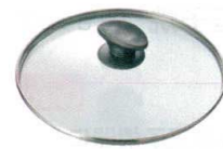
④ 強化ガラス蓋 Gタイプ