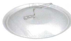
③ 業務用 アルミ フライパンカバー