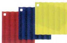
⑩ シリコン ホットマット [ANBS-01] E