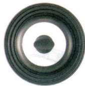
⑥ ニューウインドークックフライパンカバー