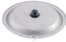
② テフロン フライパンカバー フラット型 24cm用 [AFPX-04] E