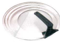
⑦ ロックインスタンド フライパンカバー