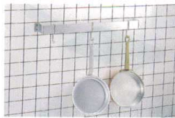
⑭ アルミウォール型ポットラック (壁取付タイプ) [APTL-01]