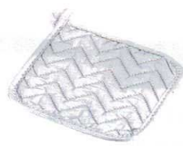
⑬ シリコン ポットホルダー