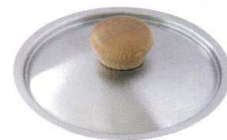
⑧ ステンレス フライパンカバー

●取手/フェノール樹脂 ●取手にぶつからないので、フライパンを傷つけません。 ●場所をとらない自立式。