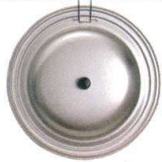
① アルミ JCフライパンカバー