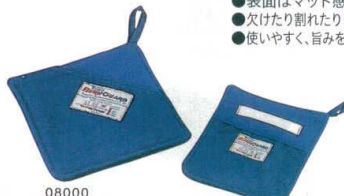
⑪ バンガード ホットパッド [ANBT-01] E

●シリコン製なのですべりにくく、耐熱性にも優れています。鍋敷・鍋つかみ・びん蓋開けなど色々使えるシリコン製マットです。