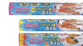
⑯ テフロン フライパン用オイル