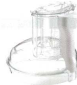
4 ボウルカバー [EPPA-16] T