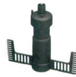
8 エッグビーター [EPPA-30] T