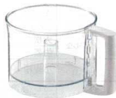
1 ボウル [EPPA-13] T