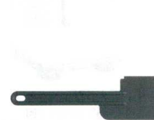
16 スパチュラ (各機種共通) [EPPA-25] T