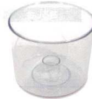
2 インナーボウル [EPPA-14] T