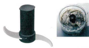
6 スチール刃 [EPPA-17] T