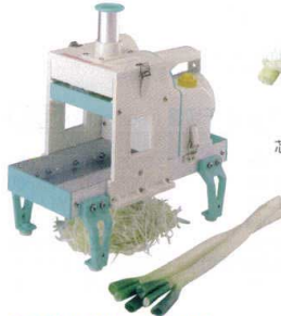
芯を抜かないタイプ (芯あり)