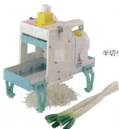
半切りにして芯を抜くタイプ (芯なし)