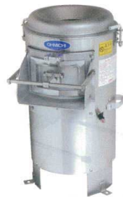
OMP-8F 洗浄ディスク(オプション)

内胴のザラザラ(カーボン)をシート状にし、マグネット方式により内胴側にピッタリ装着できます。作業終了後にシートを外すときは簡単に外せます。内部を簡単確実に洗浄でき衛生的です。