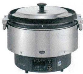
⑤ リンナイ αかまど炊き炊飯器(涼厨) RR-S500G2(5升炊き・フッ素釜) [EGSA-41] K

13-0326-0401 ¥151,800 ガス消費量: 8.37kW他③と同仕様