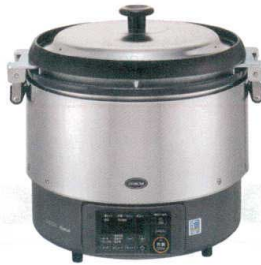
② リンナイ αかまど炊き炊飯器(涼厨) RR-S300G2(3升炊き・フッ素釜) [EGSA-39] K