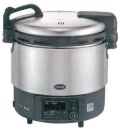
① リンナイ αかまど炊き炊飯器(涼厨) ジャー付 RR-S200GV2(2升炊き・フッ素釜) [EGSA-50] K