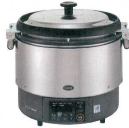
③ リンナイ ガス炊飯器(涼厨) RR-S300G2-H (3升炊き・フッ素釜) [EGSA-40] K