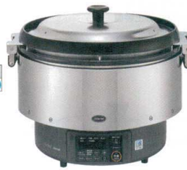
⑥ リンナイ ガス炊飯器(涼厨) RR-S500G2-H(5升炊き・フッ素釜) [EGSA-33] K