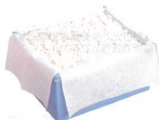
※コンテナは別売です

炊飯米から出た水蒸気を早く吸収し逆流を防ぎます。炊飯米のべたつき・ふやけを防ぎ、美味しさを長時間保ちます。炊飯米の剥離性が抜群です。袋に強度があります。ライスパックだけで移し替えができます。