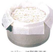
※ジャーは別売です