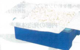
※コンテナは別売です