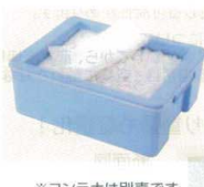
※コンテナは別売です