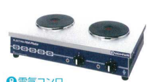
8 電気コンロ THP-2W [EDKO-08] 13-0338-0801 ¥114,000 サイズ:580×340×H120 重量:12kg 電源・消費電力:単相200V 3.0kW ヒーターサイズ:φ190×2 リード線2m・引掛プラグ付き 接地2P・20A◎