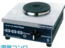
5 電気コンロ THP-1 [EDKO-05] 13-0338-0501 ¥51,000 サイズ:270×300×H120 重量:5.8kg 電源・消費電力:単相100V 1kW ヒーターサイズ:φ145 リード線2m・プラグ付き 2P・15A◎