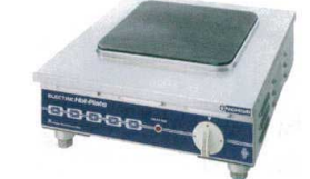
10 電気コンロ THP-4 [EDKO-10] 単相200V 13-0338-1001 ¥182,000 3相200V 13-0338-1002 ¥182,000 サイズ:450×500×H170 重量:12kg 消費電力:3.0kW ヒーターサイズ:300×300 リード線2m・プラグ付き (単相)接地2P・20A 引掛◎ (三相)接地3P・20A 引掛◎