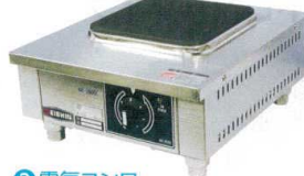
3 電気コンロ NK-2600 [EDKO-03] 13-0338-0301 ¥132,000 サイズ:350×400×H170 重量:14kg 電源・消費電力:単相200V 2.6kW ヒーターサイズ:224×224 温度調節:6段切換式