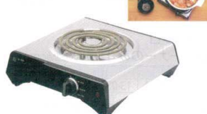
12 シュアー クッキングヒーター SK-1200R [EDKO-26] 13-0338-1201 ¥12,000 サイズ:300×325×H100 重量:2.1kg 電源:単相100V 50/60Hz 消費電力:1,200W スイッチ:4段切替(切/強1,200W・中800W・中弱400W・弱270W) ヒーター:シーズ式ヒーター(内・外2本) 適用鍋寸法:φ160~240 コード長さ:1.8m ●ヒーター下部に着脱式の汁受けトレイを採用しているため、お掃除も簡単です。 ●丈夫で長寿命なシーズヒーター採用