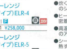
14 電気ローレンジ (卓上タイプ) ELR-4 [EDKO-12] 13-0338-1401 ¥258,000