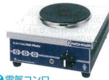
7 電気コンロ THP-2 [EDKO-07] 13-0338-0701 ¥60,000 サイズ:300×340×H120 重量:6kg 電源・消費電力:単相200V 1.5kW ヒーターサイズ:φ190 リード線2m・引掛プラグ付き 接地2P・20A◎