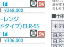
16 電気ローレンジ (スタンドタイプ) ELR-4S [EDKO-14] 13-0338-1601 ¥268,000