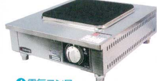
4 電気コンロ NK-4000 [EDKO-04] 13-0338-0401 ¥176,000 サイズ:450×500×H170 重量:24kg 電源・消費電力:3相200V 4kW ヒーターサイズ:324×324 温度調節:6段切換式