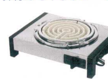
11 シュアー 電気コンロ SK-65V [EDKO-18] 13-0338-1801 ¥6,000 サイズ:290×220×H85 重量:約1.4kg(電源コード・五徳含む) 電源:単相100V 50/60Hz 消費電力:600W スイッチ:3段切替(切・弱/内300W・弱・外300W・強600W) 適用鍋寸法:底径φ160~φ240 ●毎日の手入れが楽な、ステンレス製ボディを採用 ●鍋やフライパンはもちろん、土鍋や網にも使用できます。