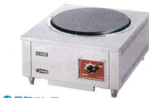
13 電気コンロ NK-6000 [EDKO-11] 13-0338-1301 ¥292,000 サイズ:500×570×H250 重量:35kg 電源・消費電力:3相200V 6kW ヒーターサイズ:φ400 温度調節:3段切替式 リード線2m・プラグ 接地3P・30A◎