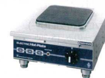
9 電気コンロ THP-3 [EDKO-09] 13-0338-0901 ¥149,000 サイズ:350×400×H170 重量:9.5kg 電源・消費電力:単相100V 2.0kW ヒーターサイズ:220×220 リード線2m・引掛プラグ付き 接地2P・20A◎