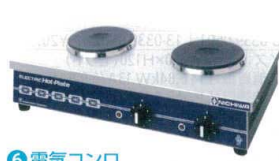
6 電気コンロ THP-1W [EDKO-06] 13-0338-0601 ¥95,000 サイズ:560×300×H120 重量:9.5kg 電源・消費電力:単相100V 1kW×2 ヒーターサイズ:φ145×2 リード線2m・プラグ付き 接地2P・15A◎×2