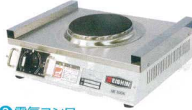
2 電気コンロ NE-100K [EDKO-02] 13-0338-0201 ¥60,000 サイズ:370×300×H100 重量:5kg 電源・消費電力:単相100V 1kW ヒーターサイズ:φ150 温度調節:6段切換式