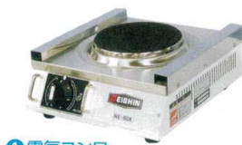
1 電気コンロ NE-50K [EDKO-01] 13-0338-0101 ¥52,000 サイズ:270×300×H100 重量:4kg 電源・消費電力:単相100V 1kW ヒーターサイズ:φ150 温度調節:6段切換式