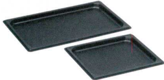
① KYS アルミニウムスティック ガストロノーム フラットパン [AAGN-05]