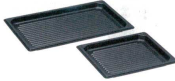
② KYS アルミニウムスティック ガストロノーム ウェーブパン [AAGN-06]