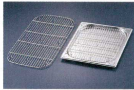
⑤ KYS 18-8 ガストロノームパン用 敷アミ(焼網) [AGNA-03]