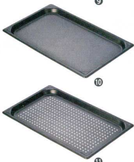
⑪ マイスター アルミニウムスティック 穴明ホテルパン [AHTP-18]