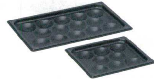
③ KYS アルミニウムスティック ガストロノーム エッグパン [AAGN-07]