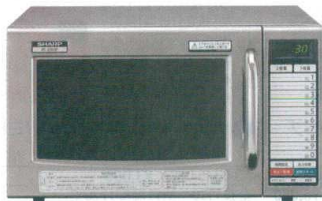
4 シャープ 業務用電子レンジ RE-3300P [ERNG-32] G

13-0347-0401 ¥100,000 サイズ:520×410×H310 庫内寸法:340×360×H200(25ℓ) 電源:単相100V 50/60Hz 消費電力:1,430W 高周波出力:800/700/600/500/200/0W相当 6段階切替 重量:13kg ●きめ細かな加熱ができる、3ステップ加熱 ●注文の多いメニューの火加減を記憶、20メモリーキー ●庫内はステンレス製で水に錆びにくく、エアフィルターは洗浄可能な着脱式