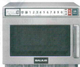
14 フクシマ 業務用電子レンジ SMW-1902G [ERNG-37] U

13-0347-1301 ¥380,000 サイズ:422×476×H337 庫内寸法:330×310×H175(18ℓ) 電源:単相200V 50/60Hz プラグ:Lバー型20A/250V 消費電力:2,800W 高周波出力:1,800/1,700/1,600/1,400/1,000/750/600/500/250/150W相当 10段階切替 重量:約18kg ●インバーター搭載で高出力1,800W!安定の仕上がりでおいしく調理ができます。 ●上下からのマイクロ波が食品に効率よくあたり、加熱ムラを抑えます。 ●食材に合わせて、出力は10段階の選択が可能です ●2段積み可能な為、2品同時に調理でき作業効率アップ!