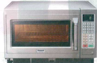
6 パナソニック マイクロウェーブ コンベクションオープン NE-CV70 [ECNV-08] L 200V

13-0347-0501 ¥260,000 サイズ:420×480×H337 庫内寸法:330×330×H175(19ℓ) 電源:単相200V 50/60Hz 消費電力:2,950W プラグ:3極20A250V(コンセントLバー型) レンジ出力:1,900/1,800/1,700/1,600/1,500/1,400/1,300/1,200/1,100/1,000/750/500/250/150/0W相当 15段階切替 重量:20kg ●きめ細かな加熱ができる、7ステップ加熱 ●見やすく操作しやすい、ホワイトバックライトデカ液晶 ●注文の多いメニューの火加減を記憶する30メモリーキー