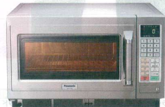
6 パナソニック マイクロウェーブ コンベクションオープン NE-CV70 [ECNV-08] L 200V

13-0347-0501 ¥260,000 サイズ:420×480×H337 庫内寸法:330×330×H175(19ℓ) 電源:単相200V 50/60Hz 消費電力:2,950W プラグ:3極20A250V(コンセントLバー型) レンジ出力:1,900/1,800/1,700/1,600/1,500/1,400/1,300/1,200/1,100/1,000/750/500/250/150/0W相当 15段階切替 重量:20kg ●きめ細かな加熱ができる、7ステップ加熱 ●見やすく操作しやすい、ホワイトバックライトデカ液晶 ●注文の多いメニューの火加減を記憶する30メモリーキー