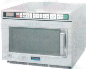
18 ホシザキ 業務用電子レンジ HMN-18D [ERNG-36] U

50Hz 13-0347-0601 60Hz 13-0347-0602 ¥417,000 サイズ:605×484×H383 重量:41kg 庫内寸法:406×336×H217(30ℓ) 電源:単相200V プラグ:Lバー型20A/250V 消費電力:3,100W ヒーター出力:1,800W 高周波出力:1,050~200W 5段階切替 オープン温度設定:100~250°C ●PROCARD(専用SDメモリーカード)で、記憶容量が大幅に拡大(最大1,000メモリー) ●1,050Wのレンジパワーでスピード調理 ●解凍から加熱、焼き上げまで、様々なメニューが出来ます。