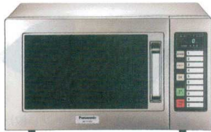
10 パナソニック 業務用電子レンジ NE-711GV [ERNG-34] U

50Hz 13-0347-1001 ¥110,000 60Hz 13-0347-1002 ¥110,000 サイズ:510×360×H306 庫内寸法:330×330×H200(22ℓ) 電源:単相100V プラグ:並行型15A/125V 消費電力:1,260W 高周波出力:700W/350W/250W相当 3段階切替 重量:約18.3kg ●700W出力で家庭用比べて1.4倍のスピード ●オールステンレスボディ&フラット底面 ●調理時間・出力を10メモリーまで記憶 ●コンパクト設計で2段積みOK!