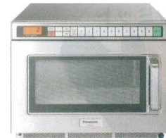
12 パナソニック インバーター 業務用電子レンジ NE-1802V [ERNG-39] G 200V

50Hz 13-0347-1101 ¥130,000 60Hz 13-0347-1102 ¥130,000 サイズ:510×360×H306 庫内寸法:330×330×H200(22ℓ) 電源:単相200V プラグ:Lバー型20A/250V 消費電力:1,570W 高周波出力:900W/450W/330W相当 3段階切替 重量:約18.5kg ●900W出力で家庭用比べて1.8倍のスピード ●オールステンレスボディ&フラット底面 ●調理時間・出力を10メモリーまで記憶 ●コンパクト設計で2段積みOK!