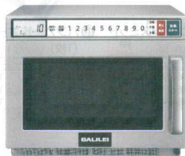
14 フクシマ 業務用電子レンジ SMW-1902G [ERNG-37] U

13-0347-1301 ¥380,000 サイズ:422×476×H337 庫内寸法:330×310×H175(18ℓ) 電源:単相200V 50/60Hz プラグ:Lバー型20A/250V 消費電力:2,800W 高周波出力:1,800/1,700/1,600/1,400/1,000/750/600/500/250/150W相当 10段階切替 重量:約18kg ●インバーター搭載で高出力1,800W!安定の仕上がりでおいしく調理ができます。 ●上下からのマイクロ波が食品に効率よくあたり、加熱ムラを抑えます。 ●食材に合わせて、出力は10段階の選択が可能です ●2段積み可能な為、2品同時に調理でき作業効率アップ!