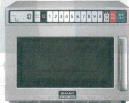
5 シャープ 業務用電子レンジ RE-7600P [ERNG-23] G 200V

13-0347-0401 ¥100,000 サイズ:520×410×H310 庫内寸法:340×360×H200(25ℓ) 電源:単相100V 50/60Hz 消費電力:1,430W 高周波出力:800/700/600/500/200/0W相当 6段階切替 重量:13kg ●きめ細かな加熱ができる、3ステップ加熱 ●注文の多いメニューの火加減を記憶、20メモリーキー ●庫内はステンレス製で水に錆びにくく、エアフィルターは洗浄可能な着脱式