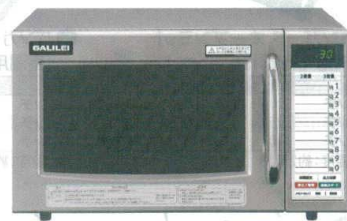
15 フクシマ 業務用電子レンジ SMW-0801G [ERNG-38] U

13-0347-1401 ¥212,000 サイズ:420×480×H337 庫内寸法:330×330×H175(19ℓ) 電源:単相200V 50/60Hz プラグ:Lバー型20A/250V 消費電力:2,950W 高周波出力:1,900/1,800/1,700/1,600/1,500/1,400/1,300/1,200/1,100/1,000/750/500/250/150/0W相当 15段階切替 重量:20kg ●注文の多いメニューやオリジナル加熱条件を記憶でき、誰でも簡単においしく調理できるメモリー機能付き。 ●水洗いできる着脱式エアフィルターとフラット庫内で、簡単にお手入れができます。