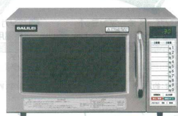
15 フクシマ 業務用電子レンジ SMW-0801G [ERNG-38] U

13-0347-1401 ¥212,000 サイズ:420×480×H337 庫内寸法:330×330×H175(19ℓ) 電源:単相200V 50/60Hz プラグ:Lバー型20A/250V 消費電力:2,950W 高周波出力:1,900/1,800/1,700/1,600/1,500/1,400/1,300/1,200/1,100/1,000/750/500/250/150/0W相当 15段階切替 重量:20kg ●注文の多いメニューやオリジナル加熱条件を記憶でき、誰でも簡単においしく調理できるメモリー機能付き。 ●水洗いできる着脱式エアフィルターとフラット庫内で、簡単にお手入れができます。