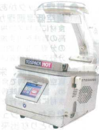
② トスパック ホットパック HVP-382N [MSKH-17] T 納 直 送 13-0355-0201 ¥989,000