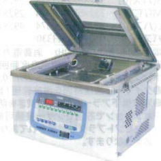
⑧ トスパック V-455G-I [MSKH-14] 納 直 送 200V 13-0355-0801 ¥1,123,000