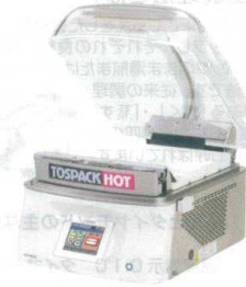
③ トスパック ホットパック HVP-482N [MSKH-24] T 納 直 送 200V 13-0355-0301 ¥1,296,000