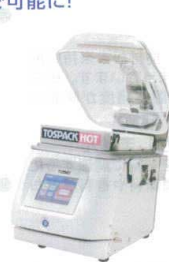
① トスパック ホットパック HVP-282 [MSKH-16] T 納 直 送 13-0355-0101 ¥645,000