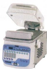
④ トスパック V-280A [MSKH-06] 納 直 送 13-0355-0401 ¥460,000