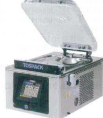
⑤ トスパック V-392 [MSKH-21] 納 直 送 13-0355-0501 ¥749,000