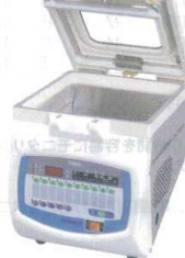
⑦ トスパック V-307G-II [MSKH-10] 納 直 送 13-0355-0701 ¥868,000