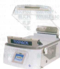
⑥ トスパック V-492G [MSKH-27] 納 直 送 200V 13-0355-0601 ¥1,133,000