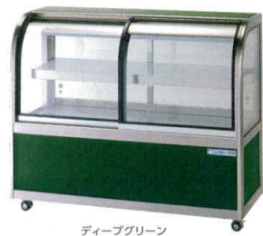
ディープグリーン