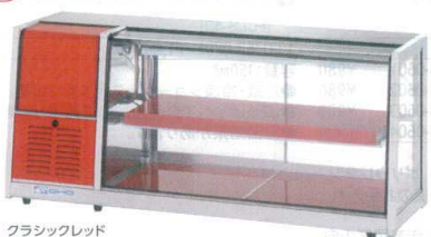
クラシックレッド