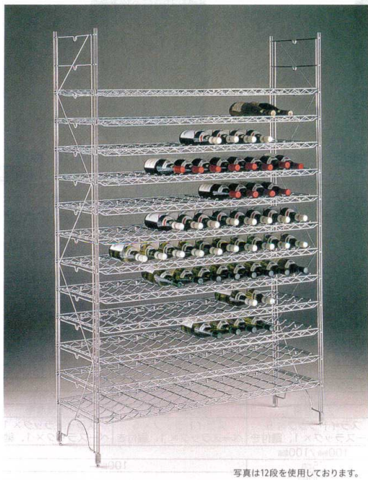
写真は12段を使用しております。

デリケートなワインだからこそ、もっと丁寧に扱いたい…。 ただ単に収納・保管するだけでなく、店舗の雰囲気づくりなど、 ディスプレイにも最適です。