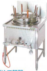
4 中華ゆで麺器 TU-1N(余熱タンクなし)