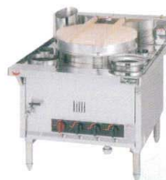
3 日本そば釜 MGS [EYMK-22] K