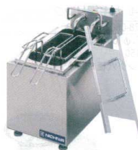
10 電気ゆで麺器 ENB-200