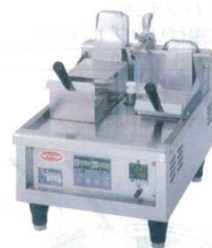
11 サニックック 冷凍麺解凍調理器 FB202 [EYMK-16] L