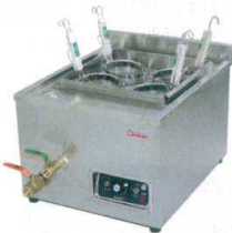
8 卓上型電気ゆで麺器