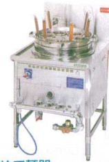
5 中華ゆで麺器 TU-1ND(余熱タンク付)