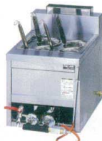
2 卓上型ラーメン釜