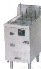
7 冷凍麺釜 MRF-046C [EYMK-12] H