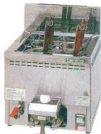
1 卓上ゆで麺器 TCU-4445X