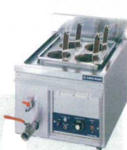
9 電気ゆで麺器 ENB-450