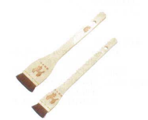
④ 木曽駒印 タレハケ (馬・胴毛・茶色)