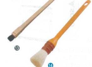
⑬ 竹柄 寿司はけ (馬毛)