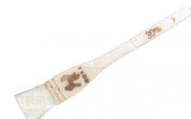
⑤ 木曽駒印 厚口 ヤンルックハケ