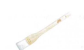
⑥ 木曽駒印 厚口 アクリルハケ