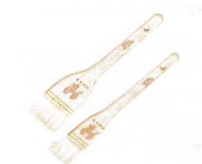
② 木曽駒印 白ハケ (山羊)