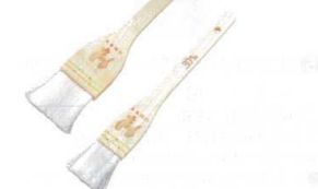
⑦ 木曽駒印 ナイロンハケ