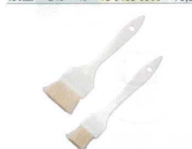
⑨ プラ柄 白ハケ (山羊)