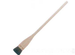
⑩ 江戸前ハケ (馬毛)