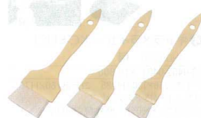
⑧ プラ柄 ナイロンハケ