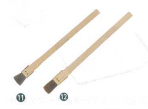
⑪ 竹柄 小物ハケ (馬毛)