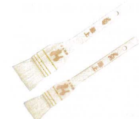
① 木曽駒印 最上白ハケ (山羊)