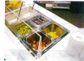
HOT & COOL (HS-1+PS-1)

13-0418-0101 ¥200,000 サイズ:262×320×H490 重量:8kg 電源:単相100V 50/60Hz 消費電力:620W 温度調節:可変式サーモスタット 温度範囲:30~90℃ 容量:5ℓ 付属品:変換プラグ、食品機械用グリース ※コーンやクルトンなどの固形物は製品内には入れず、カップに注いでから追加してください。