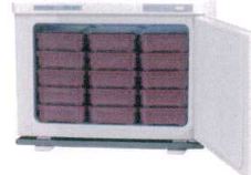
③ ホリゾン 温蔵庫 HB-118R (棚受無) [FOZK-12] E

13-0430-0201 ¥39,500 電源:単相100V 50/60Hz 消費電力:180W 外形寸法:422×283×H280 庫内寸法:346×214×H165 庫内温度:60°C~75°C 庫内容量:12ℓ(弁当箱6個) 重量:6.6kg 付属品:ドレイン受け×1 ●使いやすいシンプル設計、温度調節が いらぬサーモスタット付。