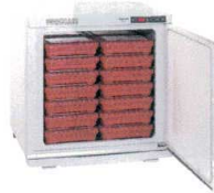
⑦ タイジ フードキャビ FC-28 [FOZK-03] E