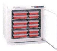
⑧ タイジ フードキャビ HC-38 (棚皿付) [FTWM-16] E