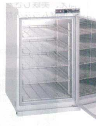
⑫ タイジ フードキャビ FC-100 (棚皿付) [FOZK-06] E