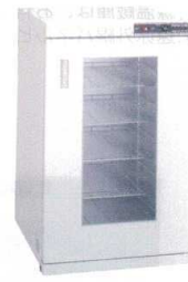
⑬ タイジ フードキャビ FC-100G (棚皿付、ガラス扉) [FOZK-07] E