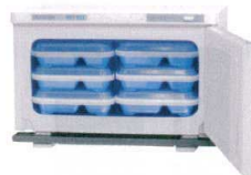
② ホリゾン 温蔵庫 HB-114R (棚受無) [FOZK-11] E

13-0430-0101 ¥36,500 電源:単相100V 50/60Hz 消費電力:130W 外形寸法:353×280×H252 庫内寸法:278×213×H145 庫内温度:60°C~75°C 庫内容量:8.3ℓ(弁当箱6個) 重量:5.4kg 付属品:ドレイン受け×1 ●使いやすいシンプル設計、温度調節が いらぬサーモスタット付。