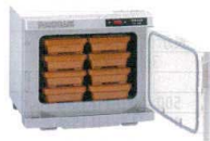
⑤ タイジ フードキャビ FC-8S [FOZK-01] E