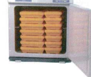
④ ホリゾン 温蔵庫 HB-40NR (棚受無) [FOZK-16] E

13-0430-0301 ¥45,500 電源:単相100V 50/60Hz 消費電力:200W 外形寸法:450×283×H350 庫内寸法:375×214×H251 庫内温度:60°C~75°C 庫内容量:20ℓ(弁当箱15個) 重量:8.2kg 付属品:ドレイン受け×1 ●使いやすいシンプル設計、温度調節が いらぬサーモスタット付。