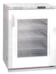
⑪ タイジ フードキャビ FC-50GN (棚皿付、ガラス扉) [FOZK-09] E