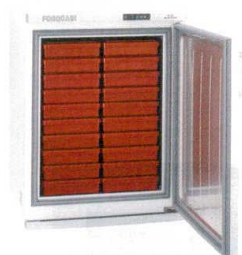
⑨ タイジ フードキャビ FC-50N [FOZK-17] E