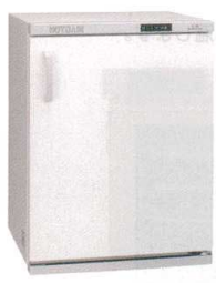
⑩ タイジ フードキャビ HC-50N (棚皿付) [FTWM-30] E