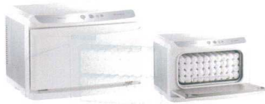
④ タイジ ホットキャビ HC-11LX Pro(前開き)

[FTWM-50] ㊦ 13-0435-0401 ¥120,000 (おしぼり=約55本) 電源:単相100V 50/60Hz 消費電力:150W 温度調節:マイコン制御 庫内温度:HOT/70~80°C(標準温度) COOL/7~10°C(周辺温度25°Cの場合) 外形寸法:450×363×H322 庫内寸法:348×207×H152 庫内容量:11ℓ 重量:10kg 付属品:棚皿×1 ドレイン受け×1 変換プラグ×1