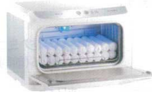
② タイジ ホットキャビ HC-11UV Pro (殺菌灯付・前開き) [FTWM-47] ㊦

13-0435-0101 ¥50,000 (おしぼり=約50本入) 電源:単相100V 50/60Hz 消費電力:120W 温度調節:電子制御 庫内温度:70°C、80°C(2段切換) 外形寸法:350×275×H290 庫内寸法:274×195×H185 庫内容量:10ℓ 重量:6kg 付属品:棚皿×1 ドレイン受け×1