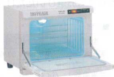
① タイジ ホットキャビ HC-10UVE (殺菌灯付・前開き) [FTWM-20] ㊦

13-0435-0101 ¥50,000 (おしぼり=約50本入) 電源:単相100V 50/60Hz 消費電力:120W 温度調節:電子制御 庫内温度:70°C、80°C(2段切換) 外形寸法:350×275×H290 庫内寸法:274×195×H185 庫内容量:10ℓ 重量:6kg 付属品:棚皿×1 ドレイン受け×1