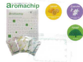
⑥ タオル蒸し器用 芳香剤アロマチップ (30個入) [FTWM-29] ㊦

[FTWM-51] ㊦ 13-0435-0501 ¥200,000 (おしぼり=約110本) 電源:単相100V 50/60Hz 消費電力:300W 温度調節:マイコン制御 庫内温度:HOT/70~80°C(標準温度) COOL/7~10°C(周辺温度25°Cの場合) 外形寸法:450×363×H562 庫内寸法:348×207×H152×2段 庫内容量:11ℓ×2 重量:17kg 付属品:棚皿×2 ドレイン受け×1 変換プラグ×1