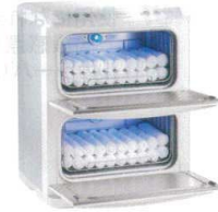
③ タイジ ホットキャビ HC-21UV Pro (殺菌灯付・前開き) [FTWM-48] ㊦

13-0435-0201 ¥75,000 (おしぼり=約55本) 電源:単相100V 50/60Hz 消費電力:190W 温度調節:マイコン制御 庫内温度:70~80°C(標準温度) 外形寸法:450×363×H322 庫内寸法:348×207×H152 庫内容量:11ℓ 重量:7.5kg 付属品:棚皿×1 ドレイン受け×1 変換プラグ×1