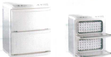
⑤ タイジ ホットキャビ HC-21LX Pro(前開き)

冷温自在 [HOT] [HOT] [COOL] [COOL] [HOT] [COOL] [HOT] [COOL]