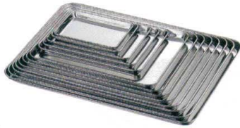
① 18-0 ケーキバット [ABTA-21]