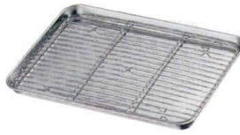
② 18-8 ケーキバット アミ [ABTA-22]