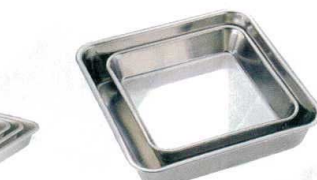
⑨ 18-8 正角バット [ABTA-37]