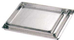
④ 18-8 角盆(ケーキ盆) [ACBA-01]