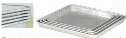
⑧ アルミ 角膳 [AKKB-01]