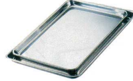
③ IKD18-8 抗菌ケーキバット [ABTA-23]