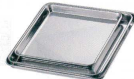
⑩ 18-0 正角盆 [AKKA-01]