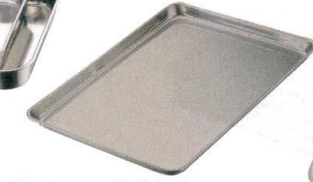
⑫ IKD 18-0 抗菌肉バット