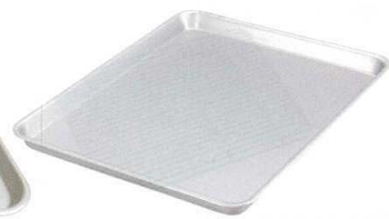
⑭ アルミ テンパン [ABTB-23]