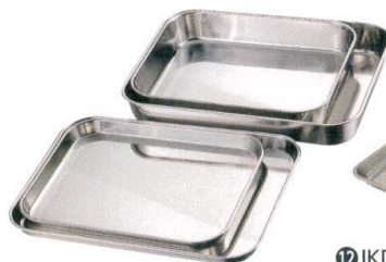
⑪ 18-8 肉バット [ABTA-24]