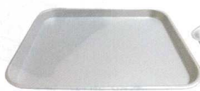
⑬ アルミ 肉バット [ABTB-20]