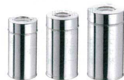
⑱ 18-8 茶缶(コーヒー・紅茶缶) [FTYS-05]