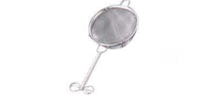
③ 18-8 共柄茶こしダブル (18+40メッシュ) [FTYK-01]