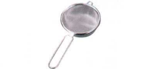
⑤ 18-8 ハイテックストレーナー (たみ織り200メッシュ) [FTYK-05]