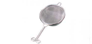
④ 18-8 共柄茶こしシングル (40メッシュ) [FTYK-02]