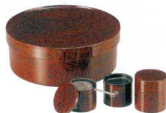
⑭ ABS製 ケヤキ木目切立 [FTYS-04]