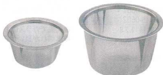
⑫ 18-8 茶こしアミ 急須用(40メッシュ) [FTYK-08] ◇