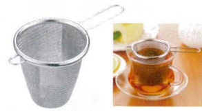
⑧ TSステンレス 18-8 ちよい茶こし (30メッシュ) [FTYT-07]