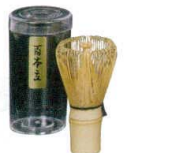
⑯ 茶せん [FTYS-01]