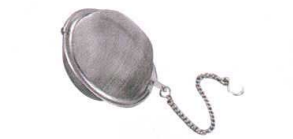
⑪ ステンレスボール茶こし (40メッシュ) [FTYK-07]