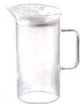
9 ハリオ グラス ティー メーカー S-GTM-40-T [GTPT-21] 洗

メッキ無 13-0472-0801 ¥1,700 金メッキ 13-0472-0802 ¥2,500 銀メッキ 13-0472-0803 ¥2,100 サイズ:φ70×140×H35