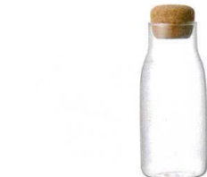
2 KINTO BOTTLIT キャニスター

13-0472-0101 ¥40,000 サイズ:264×139×H190 容量(生豆):50g 材質:ガラスボール/耐熱ガラス ツマミ/天然木 ランプホルダー/PP その他/ステンレス ●お好みの煎り加減が一目で分かり、手軽に自家焙煎が楽しめます。