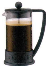
5 ポダム BLAZIL フレンチプレス式 コーヒーマーカー 120Z [GCFD-33] 洗

13-0472-0401 ¥2,500 柄長:170 ●珈琲の生豆、銀杏・ゴマ炒りに。