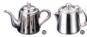
14 UK18-8 M型 ティーポット 5人用

[GTPT-23] サイズ 容量 2人用 φ84×H97 420cc 13-0472-1301 ¥5,900 5人用 φ102×H117 710cc 13-0472-1302 ¥7,700 8人用 φ118×H138 1,150cc 13-0472-1303 ¥9,300