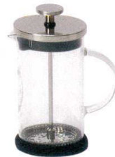
6 パイレックス コーヒープレス

13-0472-0501 ¥3,000 サイズ:115×80×H161 容量:350ml 耐熱温度:120°C