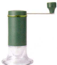
12 セラミックお茶ミル CM-50GT

サイズ 容量 THA-2SV(2人用) 135×80×H185 300cc 13-0472-1101 ¥10,000 THA-4SV(4人用) 155×95×H205 600cc 13-0472-1102 ¥12,000 材質:本体/耐熱ガラス フタ・ホルダー/真鍮 シャフト・フィルター一式/ステンレス フタつまみ/亜鉛合金 ハンドル/フェノール樹脂