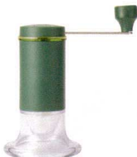
12 セラミックお茶ミル CM-50GT [GMIL-03] 洗

サイズ 容量 THA-2SV(2人用) 135×80×H185 300cc 13-0472-1101 ¥10,000 THA-4SV(4人用) 155×95×H205 600cc 13-0472-1102 ¥12,000 材質:本体/耐熱ガラス フタ・ホルダー/真鍮 シャフト・フィルター式/ステンレス フタつまみ/亜鉛合金 ハンドル/フェノール樹脂