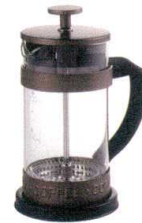
7 コーヒープレス 350ml [GPCM-02]

[GPCM-03] 洗 13-0472-0601 ¥3,000 サイズ:115×80×H165 容量:400ml 耐熱温度:120°C