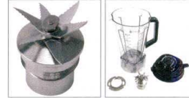
6枚刃が切削性能を高める。高い切削性能