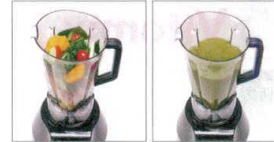
ほうれん草ピーナッツ和え+ゲル化剤

13-0480-0201 ¥150,000 サイズ:230×270×H515 重量:6kg 容器容量:2.0ℓ 処理容量:0.3~1.5ℓ 電源:100V 50/60Hz 消費電力:770W 回転数:3,000~24,000回/分 定格時間:15分(4分運転・2分休止) 電源コード:2.15m ●80℃までの温かい食材にも対応。