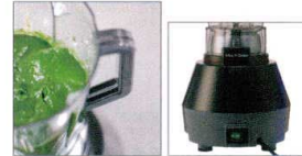
なめらかな仕上がり