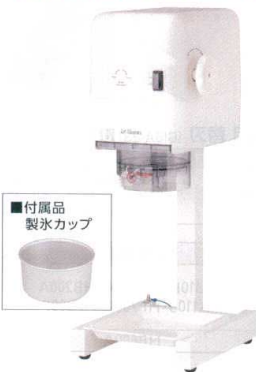
■付属品 製氷カップ