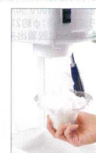
ふわふわで滑らかな口どけ 専用ミルクアイス