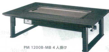
PM 1200B-MB 4人掛け