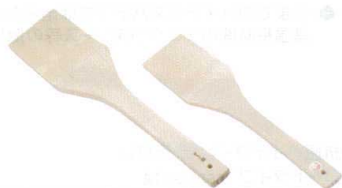
⑧ 木製 オール型スパテラ [BSPT-02] 洗