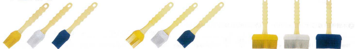
⑨ シリコン塗り刷毛 M [DHKE-09] ◇ 洗