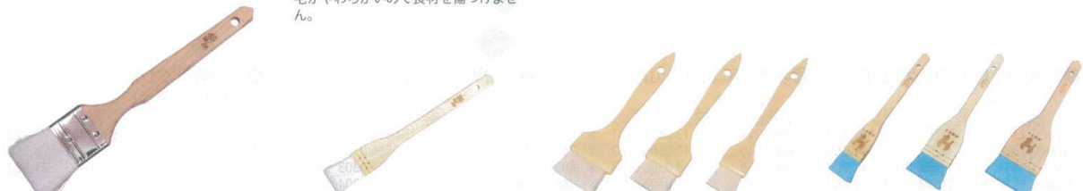
⑤ ナイロン 金巻 テリハケ