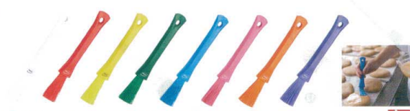
⑭ ヴァイカン USTベストリーブラシ 555130 [DHKE-16] ◇ 洗