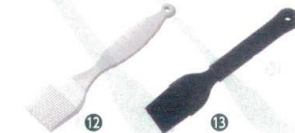
⑫ シリコン塗りばけ C-8683