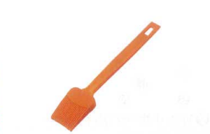
⑮ シリコンクック刷毛 No.2256