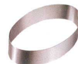
⑥ 18-8 アルゴン オーバルリング [DSLC-09]