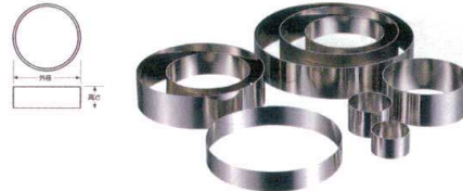
② 18-8 アルゴン溶接 ケーキリング [DSLC-01] ◇