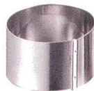
④ 18-8 かみ合せ 丸セルクル [DSLC-04]