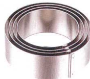
⑤ 18-8 ジャンボかみ合せ 丸セルクル (イングリッシュマフィン) [DSLC-05]