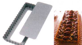
18 アルブリット セパトタルト型 長方形 No5252 [DTRT-17] 目