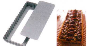
⑱ アルブリット セパトタルト型 長方形 No5252 [DTRT-17] 目