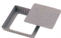
17 アルブリット セパトタルト型 正方形 No5175 [DTRT-23] 目