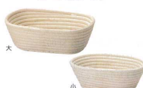
⑤ パン生地発酵用ねかしかご オーバルタイプ [DHKK-10]