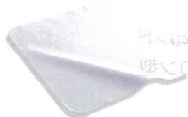
② ミューファン 抗菌パン生地マット [DPKM-01] 抗菌