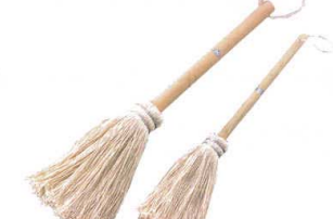
⑯ 食パン天板用 油フキ [DBAF-01]