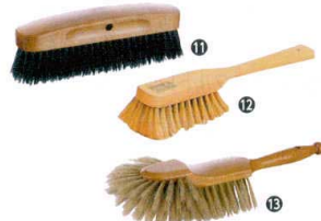
⑪ マトファ 黒ブラシ 118305 [DBBR-01]