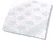
① ホテイ印 パン敷きマット [DPKM-02]