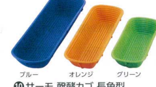
⑩ サーマ 醗酵カゴ 長角型 (ポリプロピレン) [DHKK-04]