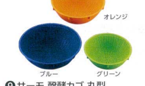
⑨ サーマ 醗酵カゴ 丸型 (ポリプロピレン) [DHKK-03]