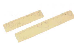
③ フランスパン生地取り板 (目盛入) KG-1090 [DPKM-03] 目

材質:綿100%(スリット系「ミューファン®」使用) ●銀の抗菌力が味方に付いた生地マット。酵母菌には影響せず、バクテリアの増殖だけを抑えます。 ※ご使用の状況によっては、カビが発生する場合がございます。