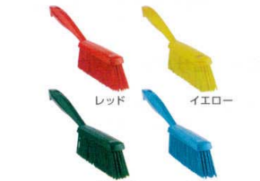
⑮ ペーカリーブラシ ミディアムタイプ 4589 [DBBR-07]