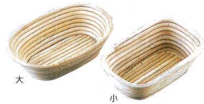
⑦ 籐製 醗酵カゴ 小判型 [DHKK-05]