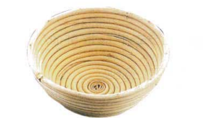
⑧ 籐製 醗酵カゴ 丸型 [DHKK-06]