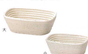
④ パン生地発酵用ねかしかご 長角タイプ [DHKK-09]