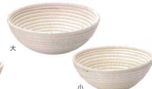
⑥ パン生地発酵用ねかしかご 円タイプ [DHKK-11]