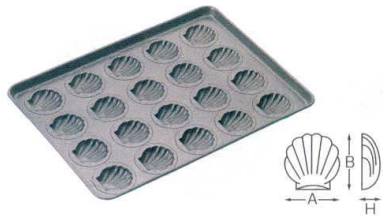
④ プロアスター ぼたて貝型天板 20面 [DKTV-08]

サイズ 出来上がり寸法 25面 545×395×H45 A77×B45×H18 13-0594-0301 ¥27,500 30面 545×395×H40 A83×B42×H11 13-0594-0302 ¥27,500 材質: アルミメッキ鋼板(内面フッ素樹脂加工)