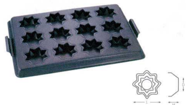
⑩ WJ テフロン 星型天板 12面 [DKTV-39]

13-0594-0901 ¥15,400 サイズ: 590(取手含)×395×H30 出来上がり寸法: L63×D63×H20