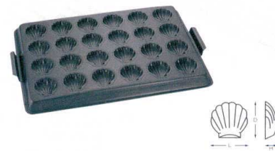
⑧ WJ テフロン ぼたて貝型天板 24面 [DKTV-37]

13-0594-0701 ¥15,400 サイズ: 590(取手含)×395×H30 出来上がり寸法: L72×D50×H17