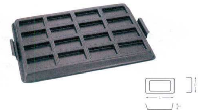
⑫ WJ テフロン フィナンシェ天板 16面 [DKTV-41]

13-0594-1101 ¥15,400 サイズ: 590(取手含)×395×H30 出来上がり寸法: L100×D45×H13