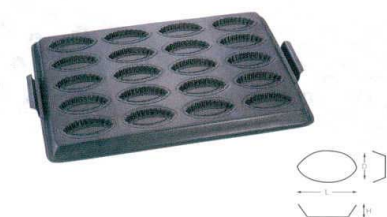
⑪ WJ テフロン 波型ボート天板 20面 [DKTV-40]

13-0594-1001 ¥15,400 サイズ: 590(取手含)×395×H33 出来上がり寸法: L98×D63×H33