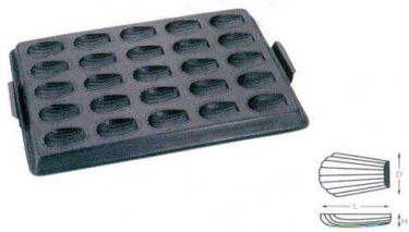
⑦ WJ テフロン 貝型マドレーヌ天板 25面 [DKTV-36]

13-0594-0701 ¥15,400 サイズ: 590(取手含)×395×H30 出来上がり寸法: L72×D50×H17