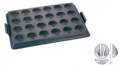
⑨ WJ テフロン 貝型天板 24面 [DKTV-38]

13-0594-0801 ¥15,400 サイズ: 590(取手含)×395×H30 出来上がり寸法: L60×D60×H18