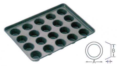
⑥ プロアスター バターフレーキ型天板 20面 [DKTV-13]

13-0594-0501 ¥44,000 サイズ: 545×395×H34 出来上がり寸法: A85×B42×H12 材質: アルミメッキ鋼板(内面フッ素樹脂加工)