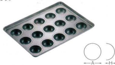
② プロアスター わん型天板 [DKTV-06]

13-0594-0101 ¥27,500 サイズ: 545×395×H45 出来上がり寸法: A77×B48×H15 材質: アルミメッキ鋼板(内面フッ素樹脂加工)