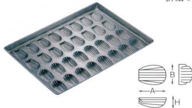
① プロアスター 貝型天板 32面 [DKTV-05]

13-0594-0101 ¥27,500 サイズ: 545×395×H45 出来上がり寸法: A77×B48×H15 材質: アルミメッキ鋼板(内面フッ素樹脂加工)