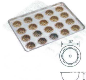
① シリコン加工 プディング型