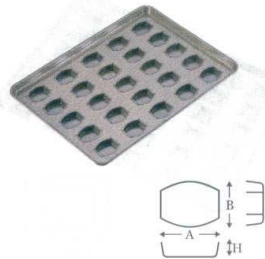
② シリコン加工 タイコ型