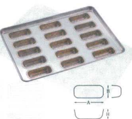
⑪ シリコン加工 フィンガー型