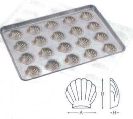
⑦ シリコン加工 コキーク型