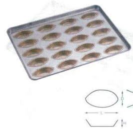
④ シリコン加工 ボート100型