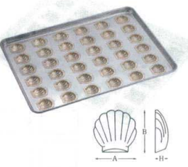
⑥ シリコン加工 ほたて貝型