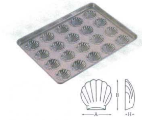
⑤ シリコン加工 ほたて貝型