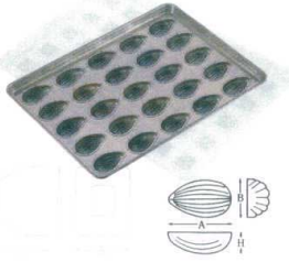
⑮ シリコン加工 アモンドナッツ型