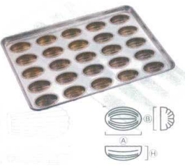
⑭ シリコン加工 アーモンドショコラ型