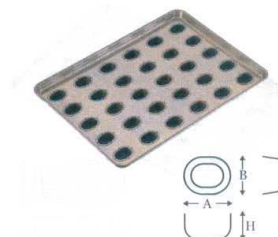
⑨ シリコン加工 リージェント型