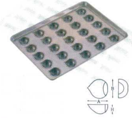
⑯ シリコン加工 マロンケーキ型