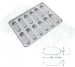
⑩ シリコン加工 シュトーレン型