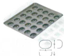
⑫ シリコン加工 玉子型

L 545×395×H57A116×B46×H35 13-0597-1102 ¥31,500