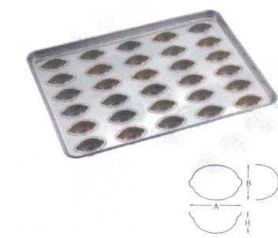
⑬ シリコン加工 プチレモン型