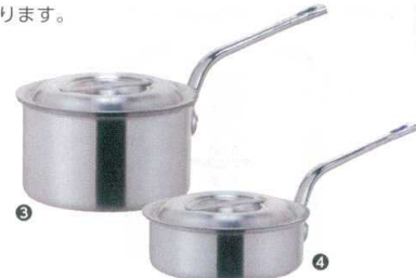
③ KYS アルミ片手鍋 (目盛付) [AKFB-04]