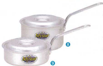
⑧ アルミ マスター 片手鍋 [AKFB-03] V