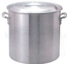
① KYS アルミ寸胴鍋 (目盛付) [AZUB-03]