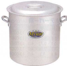
⑤ アルミ マスター 寸胴鍋 [AZUB-04] V