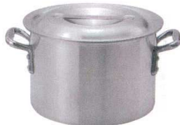
② KYS アルミ半寸胴鍋 (目盛付) [AHZB-03]