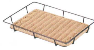
⑫ PPラタン 金色スチールパンラック パントリー付 アイボリー [DPSN-14]