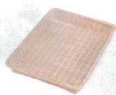
1 浅型籐かご Y-4-WH 白

[DBSK-20] 目 13-0607-0101 ¥6,490 サイズ:400×300×H40 フチ鉄芯入り ●フチ部分に鉄芯が入っており、型くずれしません。