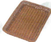
2 浅型籐かご Y-4-CH 茶

[DBSK-20] 目 13-0607-0101 ¥6,490 サイズ:400×300×H40 フチ鉄芯入り ●フチ部分に鉄芯が入っており、型くずれしません。