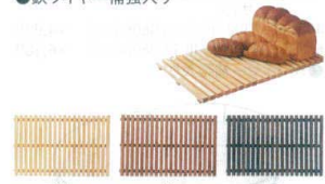
11 木製すのこ PW-3860 [DPSN-08]

13-0607-1001 ¥67,800 サイズ:φ526×H210(ベース:φ300) 材質:スタンド/鉄(黒焼付塗装)