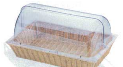
17 ポリカーハーフトップカバー(角)付 ベーカーバスケット BB-409-IV [DBBS-01]

PDY05 13-0607-1601 ¥1,000 PDY05BR 13-0607-1602 ¥1,500 サイズ:350×100×H60 ワイヤー入り ●すのこの仕切りとして自由に調整できます。