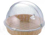
18 ポリカーハーフトップカバー(丸)付 ベーカーバスケット BB-413-IV [DBBS-02]

13-0607-1701 ¥19,850 サイズ:555×340×H280 材質:プレッドバスケット/PPラタン(ポリプロピレン) 耐熱温度:120℃ 食品衛生法適合 ●ステンレスワイヤー補強入り