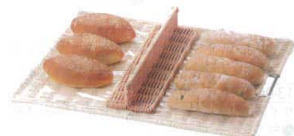
16 籐 仕切り板 [DPST-20]

サイズ 深さ 大 600×400×H40 25 13-0607-1501 ¥13,200 中 500×350×H40 25 13-0607-1502 ¥12,320 小 430×300×H40 25 13-0607-1503 ¥10,890 ●使用しているうちに主線のスポットがよく外れるので、アルゴン点付溶接に仕上げました。