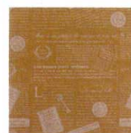
クラフトフレンチ