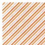
オレンジストライプ