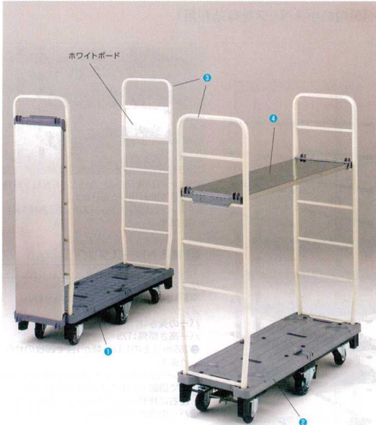
※ホワイトボードはオプションです