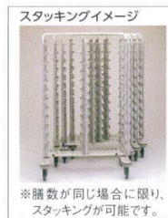
スタッキングイメージ