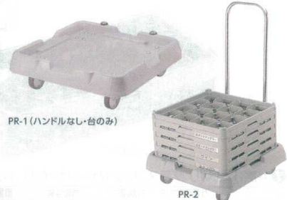
PR-1 (ハンドルなし・台のみ)

HB-8-155 ¥10,700 仕切り内寸法:112×112 有効深さ:157 外形寸法:250×500×H185 重量:1.77kg ※シルバーバスケットを含みません。 ※カラーは対応できません。