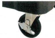
320S/550S サイレントキャスター