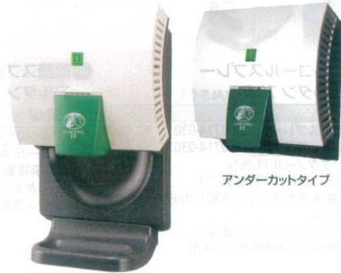
スタンダードタイプ