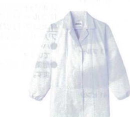
⑧ 女性用調理衣 長袖 FA-335 (ホワイト) [LTYI-06] E 抗菌