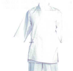
⑪ ハッピー H-351 (ホワイト) [LHAP-01] E 抗菌