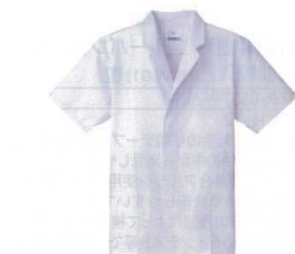
⑤ 男性用調理衣 半袖 FA-312 (ホワイト) [LTYI-03] E 抗菌

ポリエステル65%+綿35%、ポプリン/フレッシュエア加工 ●左胸外、両腰外ポケット