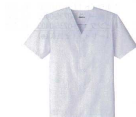
⑥ 男性用調理衣 半袖 FA-322 (ホワイト) [LTYI-04] E 抗菌

ポリエステル65%+綿35%、ポプリン/フレッシュエア加工 前身ヒヨク留 ●左胸外、両腰箱ポケット