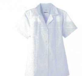
⑩ 女性用調理衣 半袖 FA-337 (ホワイト) [LTYI-08] E 抗菌