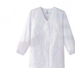
⑦ 女性用調理衣 長袖 FA-330 (ホワイト) [LTYI-05] E 抗菌

ポリエステル65%+綿35%、ポプリン/フレッシュエア加工 ●左胸外、両腰外ポケット