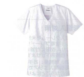
⑨ 女性用調理衣 半袖 FA-332 (ホワイト) [LTYI-07] E 抗菌