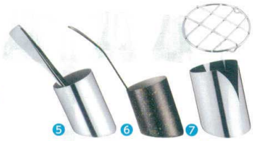
⑤ 18-8 ピサ マルチスタンド (目皿付) [BTGX-16] E

13-0771-0401 ¥28,680 サイズ:420×360×H575 材質:ピーチ・ラミン材(ウレタン塗装)、 人造大理石 ※トング・トレイは含まれません。