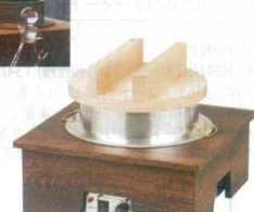
⑭ 羽釜ウォーマー [NHGW-01] ◆U 値

13-0771-1301 ¥212,000 釜サイズ:φ445×H315(木蓋含む) 内寸:φ370×H280 台サイズ:575×520×H180 容量:21ℓ 重量:7.8kg 底径:φ280