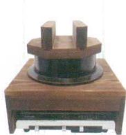
⑪ 電磁用アルミ製1升釜・ハカマセット (焼杉木蓋付) [AKMA-13] E 納値

13-0771-1101 ¥62,000 釜サイズ:φ290×H280(木蓋含む) 内寸:φ221×H176 台サイズ:360×360×H155 容量:6ℓ 重量:5.2kg 底径:φ174