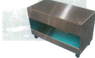
⑨ UVパワーライト HUV-B62 [CSKT-02] ◆M

13-0771-0801 ¥22,000 サイズ:300×100×220 重量:約2.2kg 電源:単相100V 殺菌線出力:1.7W 紫外線波長:253.7nm(ピーク波長) 定格ランプ寿命:約9,000h ●ピュッフェなど料理を取り分ける際に使用するトングに直 接照射できるコンパクトタイプ。使用しない間は常に除菌 している状態で、安心してご使用いただけます。 ※トング・皿は別売です。