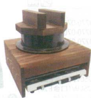
⑫ 電磁用アルミ製2升釜・ハカマセット (焼杉木蓋付) [AKMA-14] E 納値

13-0771-1101 ¥62,000 釜サイズ:φ290×H280(木蓋含む) 内寸:φ221×H176 台サイズ:360×360×H155 容量:6ℓ 重量:5.2kg 底径:φ174