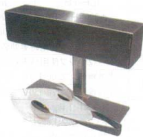
⑧ UVパワーライト HUV-A61 [CSKT-01] ◆M

カトラリーをその場で除菌 パン屋・惣菜店・フードコート・社員食堂・buffetなどのシーンで好評です。