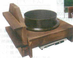
⑬ 電磁用アルミ製3升釜・ハカマセット (焼杉木蓋付) [AKMA-15] E 納値

13-0771-1201 ¥118,000 釜サイズ:φ400×H315(木蓋含む) 内寸:φ327×H216 台サイズ:494×494×H175 容量:17ℓ 重量:5.2kg 底径:φ174