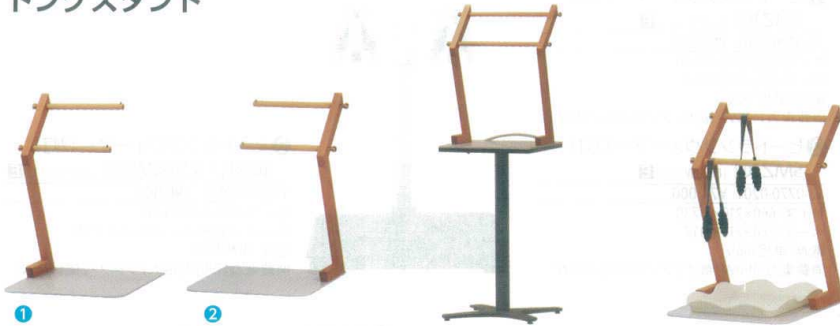
① 木製セルフスタンド R BSS-L01 [BTGX-13] ◆E

13-0771-0101 ¥20,280 サイズ:420×360×H575 材質:ピーチ・ラミン材(ウレタン塗装)、 人造大理石