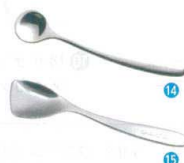
⑭ 18-8 ののじ UD離乳食スプーン