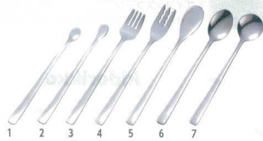
㉓ 18-8 ヘルパーライラック [OKGC-01]