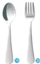
⑲ 18-0 ミール スプーン

食事を意味するミールには、誰でも食事をとれるという意味があります。介護用に発案し、食卓になじみやすい穏やかな曲線に優しさを感じるデザインに仕上げました。軽さや安全性、使い勝手の良さを追求し、誰もが使いやすいハンドルです。介護者が食べさせやすいロングハンドル仕様もご用意しております。