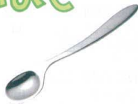
⑫ 18-8 ののじ UDソフトスプーン