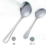
㉔ 18-8 ヘルパーズプーン 右手用

●介護用に柄を長くしてあります。 ●高齢者、幼児用に先を小さくしてあります。 ●食材の送り込みが難しい方に最適です。