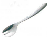
⑬ 18-8 ののじ UDカットフォーク