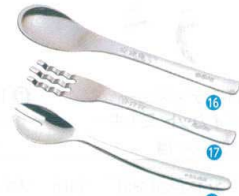
⑯ 18-8 ののじ 幼児用ごはんスプーン