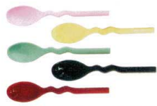
15 口あたりのやさしいスプーン ウェビー 深型 [O0SS-09] B