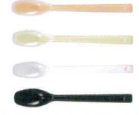
8 プリグレースプーン 一体ヘラ深型 [OKSS-08]