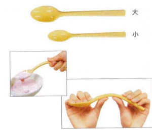
16 フレックス シリコンスプーン [O0SS-05] B