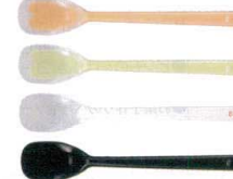
7 プリグレースプーン 一体ヘラ型大 [OKSS-07]