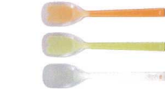
2 プリグレースプーン ヘラ型大 [OKSS-02]