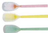
9 口あたりのやさしいスプーン 大(ラージ) [O0SS-07] B