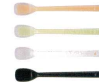
6 プリグレースプーン 一体ヘラ型 [OKSS-06]