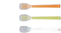
1 プリグレースプーン ヘラ型 [OKSS-01]