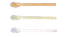
5 プリグレースプーン ピュア [OKSS-05]