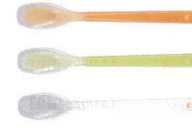
3 プリグレースプーン 深型 [OKSS-03]