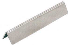
⑤ SW18-8 ナイフレスト 三角バー