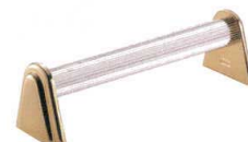
⑰ UK ナイフレスト RG [PKRT-02]