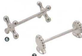
⑥ SW ナイフレスト(銀メッキ)