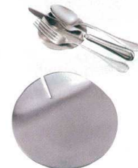
⑱ 18-8 スマートカトラリーレスト