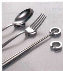
⑭ 18-8 TD 三角型 箸・ナイフ・フォークレスト

サイズ:φ32×H8 ●指輪のようなかわいいデザイン。 箸もカトラリーも素敵に彩ります