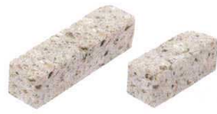
② 以為 大谷石箸置 カクコロ