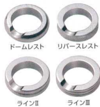
⑬ 18-8 リングレスト [OHSO-30] E