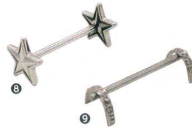
⑧ SW ナイフレスト スター