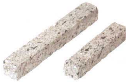
① 以為 大谷石箸置 フトコロ

石の欠点である劣化のしやすさを特殊コーティングで防ぎ、柔らかく温かみのある大谷石の素材感をそのまま味わえます。消臭、抗菌、防カビに抗酸化機能を備えた無機触媒塗装でコーティングされている為、汚れてもお手入れが簡単です。