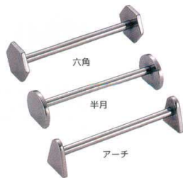
⑮ UK18-8 ナイフレスト [PKRT-04]