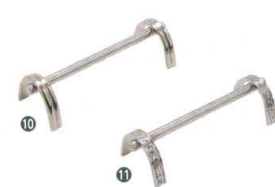
⑩ SW18-8 ナイフレスト B測