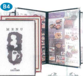
12 メニューブック ABW-11・8P [QMNb-15] F