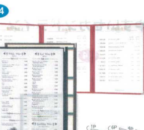
11 メニューブック ABW-11・6P [QMNb-14] F