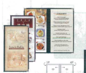
6 メニューブック ABW-21 [QNMb-24] F