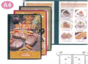
2 メニューブック ABW-7 [QMNb-07] F