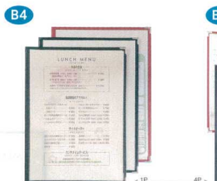
10 メニューブック ABW-11・4P [QMNb-13] F

13-0885-0901 ¥1,500 サイズ:270×378 B-4(2P) 中紙:洋-21