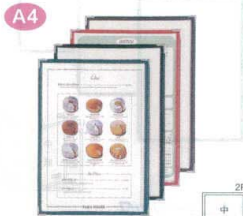
1 メニューブック ABW-17 [QMNb-16] F