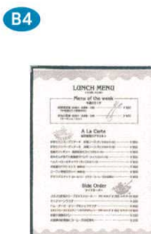
9 メニューブック ABW-18(2P) 黒 [QMNb-23] F

13-0885-0901 ¥1,500 サイズ:270×378 B-4(2P) 中紙:洋-21