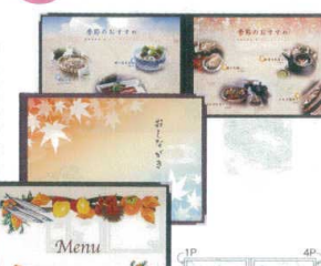
7 メニューブック ABW-23 [QNMb-22] F