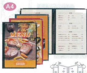
5 メニューブック ABW-9 [QMNb-09] F