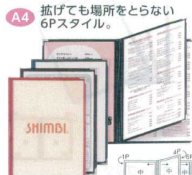
3 メニューブック ABW-20(6P) [QMNb-24] F