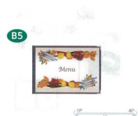
8 メニューブック ABW-24 茶 [QNMb-21] F