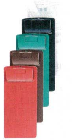
③ お会計クリップ CLIP-103 [QKKC-03] F