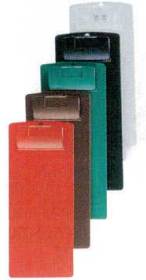
② お会計クリップ CLIP-102 [QKKC-02] F