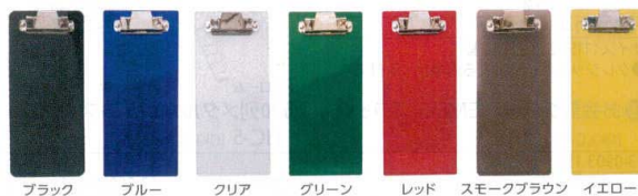
⑬ コンパクト Cボード [QKKC-24] U