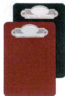
⑨ お会計クリップ クリップ-12N [QKKC-12] F