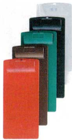
① お会計クリップ CLIP-101 [QKKC-01] F

お会計クリップ ABS樹脂製。テプラ・シール等やテーブルナンバーを貼れる凹部スペース付きです。 軽くて丈夫!! オールプラスチックの伝票クリップ!!