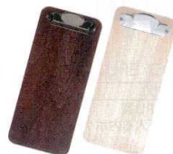
⑩ お会計クリップ AC-5N [QKKC-13] F