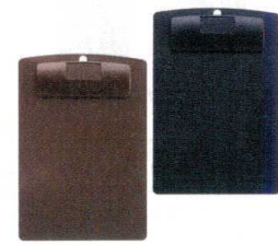
④ お会計クリップ CLIP-104 [QKKC-04] F