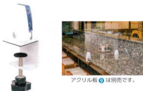
アクリル板⑧は別売です。