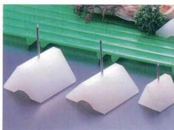
⑪ PC活造り用マクラ(2ヶ1組)