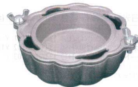
⑦ 菊型製氷器 37003 [RSHK-03]