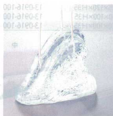
⑫ 波石クリスタル(アクリル樹脂)