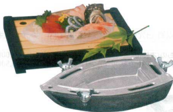
⑤ 舟型製氷器 37001 [RSHK-02]