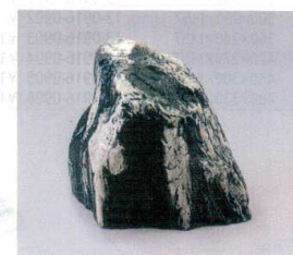
⑬ 模造石(ウレタン樹脂)