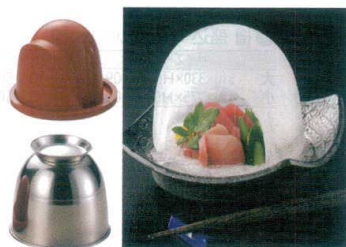
⑧ かまくら製氷器 37014 [RSHK-09]