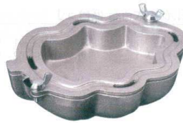
⑥ 木の葉型製氷器 37002 [RSHK-06]