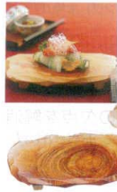
① 桧 彫刻節付盛台 [RMOD-11]