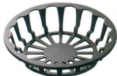
① M11-300 アルミ受籠 [RUKA-04] 13-0932-0101 ¥830 サイズ: φ173(内寸径φ149×H35)