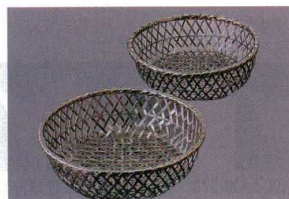
⑪ 竹製 受籠(黒) [RUKA-03] 内寸 底径 M40-850 24cm φ225×H65 φ185 13-0932-1101 ¥2,200 M40-851 27cm φ250×H75 φ200 13-0932-1102 ¥2,420