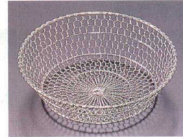
③ 手あみ製 受網 M20-318 15.5cm [RUKA-01] 13-0932-0301 ¥2,400 内寸: φ145×H40 底径: φ110 材質: ステンレス製