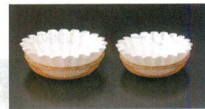
⑨ 紙すき鍋 奉書 花 (300枚入) [RKSN-18] 底径 M33-268 φ330 φ150 13-0932-0901 ¥28,200 M33-269 φ390 φ170 13-0932-0902 ¥31,500 ※受網は別売です。