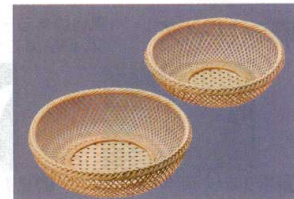
⑬ 竹製 受籠 菱目 [RUKA-06] 内径 底径 M40-857 小 φ230×H65 φ170 13-0932-1301 ¥5,200 M40-858 大 φ250×H75 φ200 13-0932-1302 ¥6,000