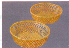
⑫ 竹製 受籠(茶) [RUKA-05] 内径 底径 M40-855 24cm φ225×H65 φ185 13-0932-1201 ¥2,200 M40-856 27cm φ250×H75 φ200 13-0932-1202 ¥2,420