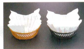
⑧ 紙すき鍋 奉書 (300枚入) [PKSN-17] 底径 M33-266 34cm φ150 13-0932-0801 ¥21,900 M33-267 40cm φ170 13-0932-0802 ¥25,200 ※受網は別売です。