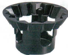
⑤ アルミ 扇コンロ SA-010(黒色) [RTJK-05] U 13-0932-0501 ¥2,800 サイズ: φ150×90 ●使いやすく、質感が美しいコンロです。