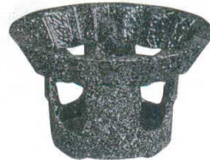
⑥ アルミ 扇コンロ SA-080(黒みかげ) [RTJK-06] U 13-0932-0601 ¥4,400 サイズ: φ150×90 ●使いやすく、質感が美しいコンロです。