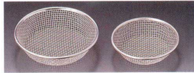
② ステンレス製 受網 [RUKA-02] 内寸 底径 M20-319 14.5cm φ140×H40 φ110 13-0932-0201 ¥830 M20-324 12cm φ110×H30 φ85 13-0932-0202 ¥830