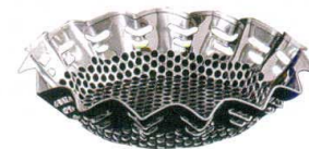
⑦ ステンレス 鍋ホルダー S-100 [RKSN-25] U 13-0932-0701 ¥1,050 サイズ: φ175×40 ●プレス一体加工でやぶれ、型崩れなく長くお使いいただけます。 ●サイドのくぼみがコンロにぴったりフィット。ぐらつきを防止、安定した調理ができます。

電磁調理用 プレス加工がしてある為、セットしやすく、型崩れしにくくなっています。電磁調理器で使用できる竹製受籠を使った紙すき鍋です。